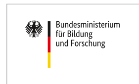
Farbe („Spot“, „CMYK“, „Plot“)

Die Bild-Wort-Marke steht immer linksbündig auf dem Identitätsbereich. Der Identitätsbereich stärkt die visuelle Präsenz der Bild-Wort-Marke. Er besteht aus einer weißen Fläche, die als Hintergrund für die Bild-Wort-Marke dient.